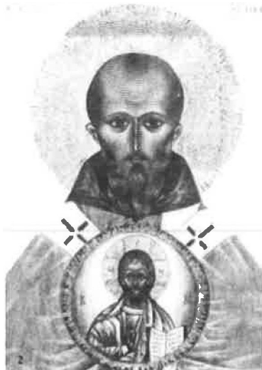
St Honorat de Lérins : il ne peut avoir enfanté le Christ !