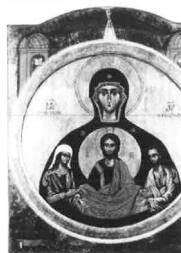
Notre Dame de l'Alliance - icône incohérente, la Vierge n'a pu enfanter le Christ adulte et de jeunes époux !

Icône Juste : La Vierge du Signe (ou Vierge orante). Le Christ en médaillon est encore dans le sein de sa Mère, cette icône est vénérée avant Noël.