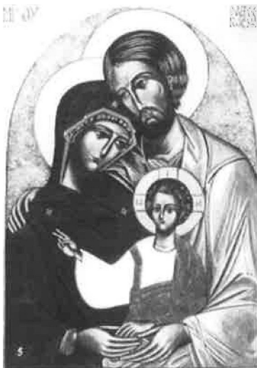
Icône théologiquement fautive de la Sainte Famille